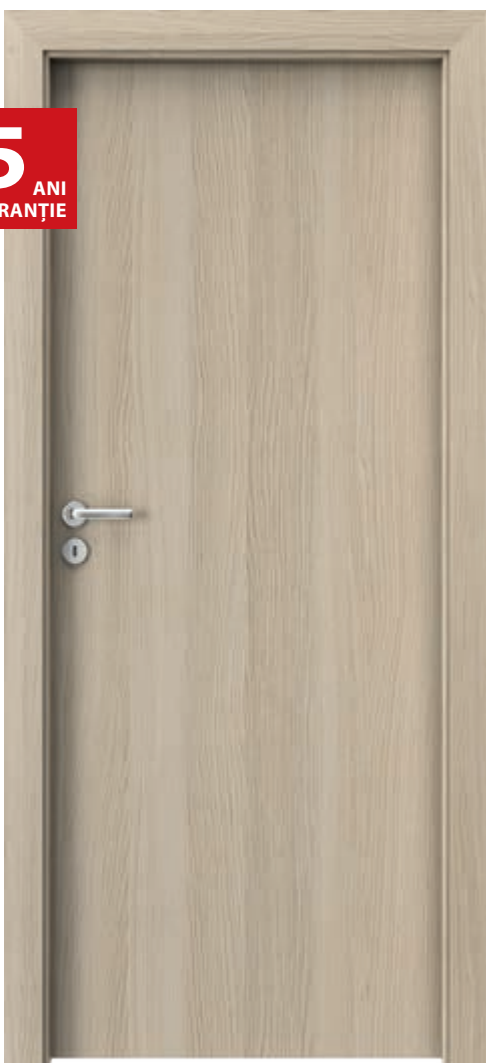
Laminate CPL, 1.1.Stejar Milano 1