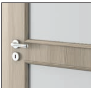
ramă cu sticlă