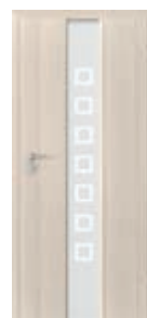
model 2.0 sticlă model „pătrățele”