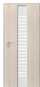
model 2.0 sticlă model „scăriță”