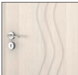
frezaj - model 1.D