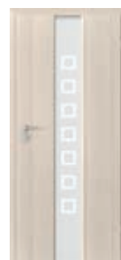
model 2.0 sticlă model „pătrățele”