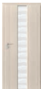
model 2.0 sticlă „zebra” albă mată