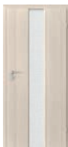
model 2.0 sticlă „sah” albă mată