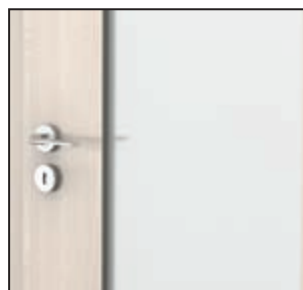
îmbinare cu sticlă profil „cant dreptunghiular” – modelele gr. 3 și 4