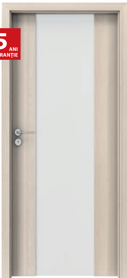
Porta FOCUS 4.B, sticlă mată, Nuc Alb