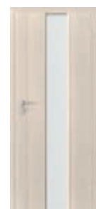
model 2.0 sticlă mată