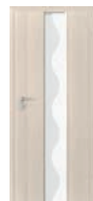
model 2.0 sticlă model „valuri”