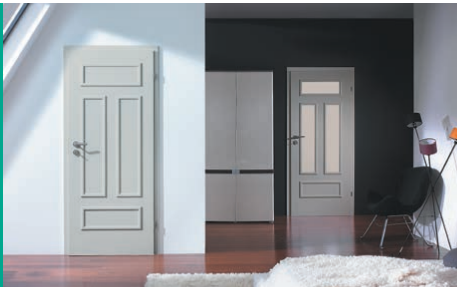
Porta GRANDDECO 2.1 și 2.3, Alb