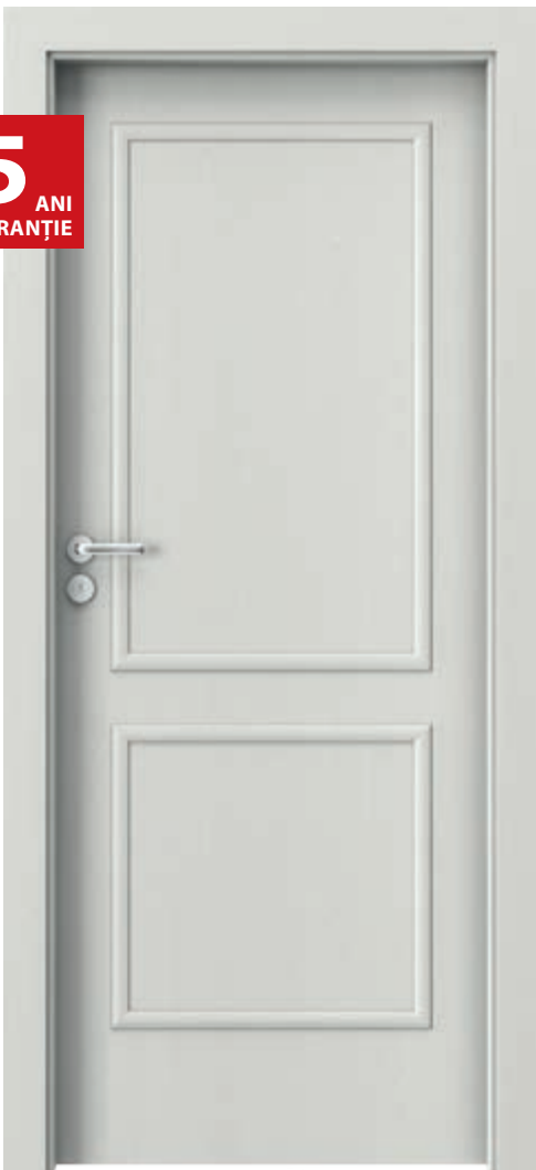
Porta GRANDDECO 3.1, Wenge Alb