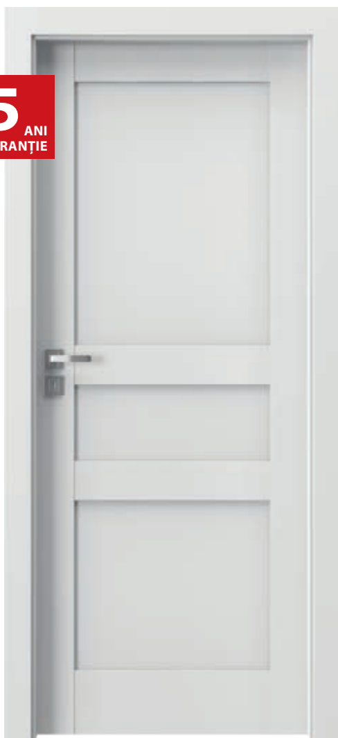
Porta GRANDE D.0, Ivoiriu (RAL 9010)