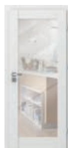
model A.1 cu oglindă