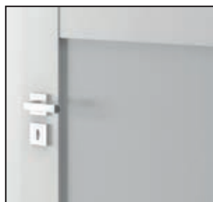
mâner cu șild