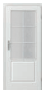
VIENA grilă mică