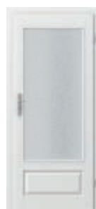
ROYAL geam mare