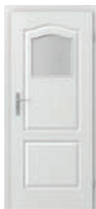
LONDRA geam mic