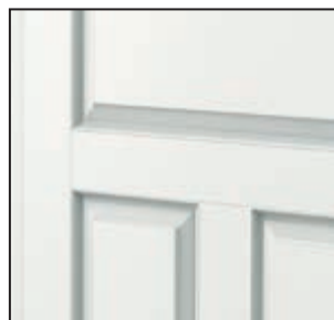
îmbinare cu panou – Porta ROYAL