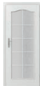
LONDRA grilă mare