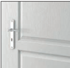
finisaj structură granulară – LONDRA, VIENA

Vezi filmul de prezentare al colecției, în limba poloneză www.porta.com.pl/dm/portaroyal.wmv