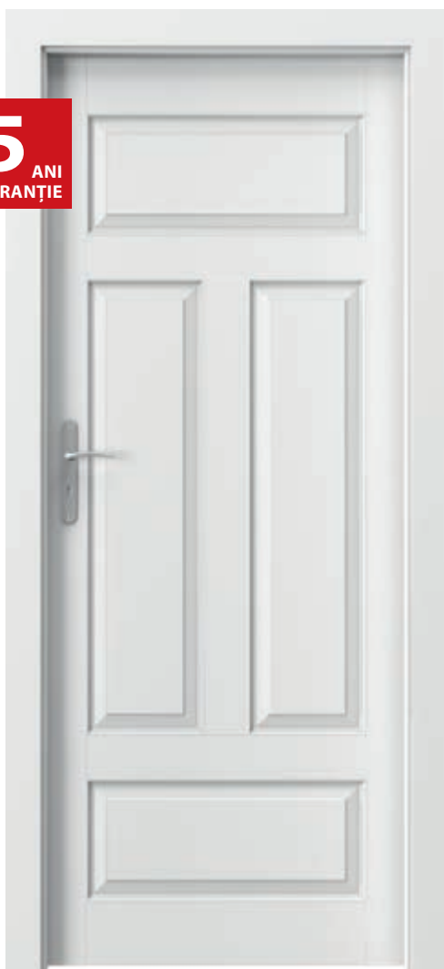
Porta ROYAL, plină, Alb