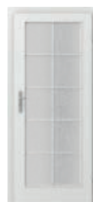
VIENA grilă mare