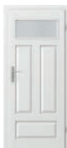
ROYAL geam mic