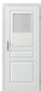
VIENA geam mic